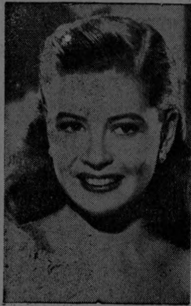
GLORIA DE HAVEN, la adorable estrella de MGM, sigue con devoción el consejo de Max Factor Jr., de someterse a la acción de una luz poderosa y brillante mientras se maquilla

Como en el resto de los deportes, el hombre no deberá mostrarse menos considerado con las personas de sexo femenino, y éstas últimas conservarán su feminidad, ya que las prácticas deportivas no las autorizan a proceder de otro modo. La cortesía ha establecido, para estos casos, debe montarse primero en el caballo, la dama o el jinete más importante. A ellos deberá cederse, asimismo, la derecha, y si se marcha en compañía de una persona que ocupa un lugar eminente en la sociedad, bueno